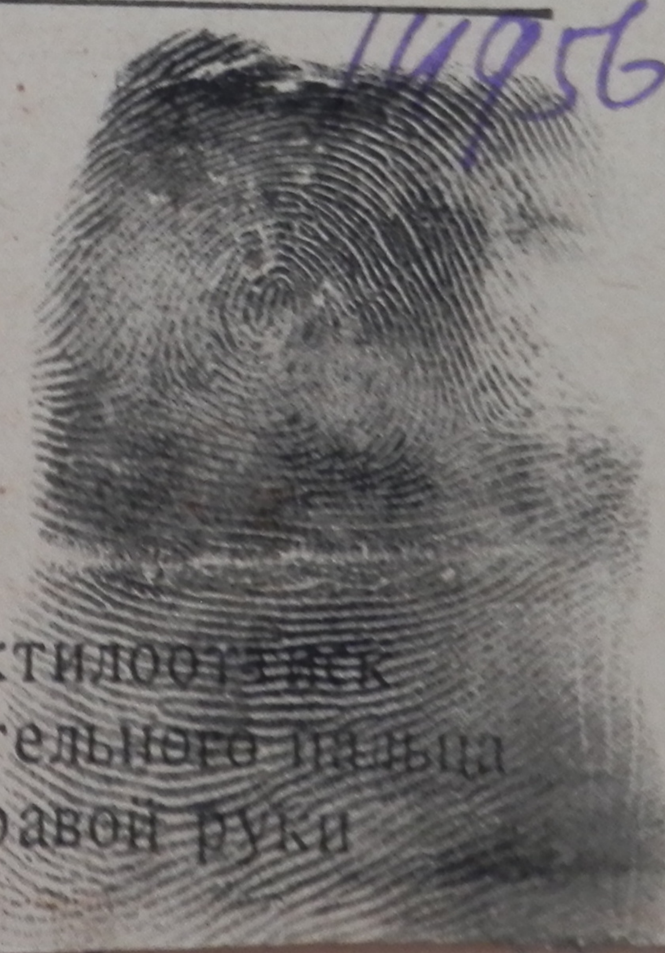
Дактилоотиск указательного пальца правой руки

фильтрацию прошел с 11/VI 1945 г. по 8/IX 1945 г.